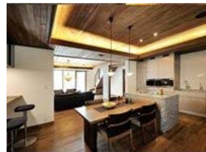
▲ハウスメーカーのモデルハウスにも採用されています。

当社は、マンション(集合住宅)、ハウスメーカー 一般のお客様とバランスよく それぞれの顧客特性にあったオーダーキッチンを展開。 そこで、より組織強化を図っていくため、 様々な分野で活躍する方を広く求めています。