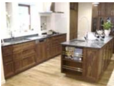
▲「スウェーデンハウス」のモデルハウスにも当社のキッチンが採用されました！