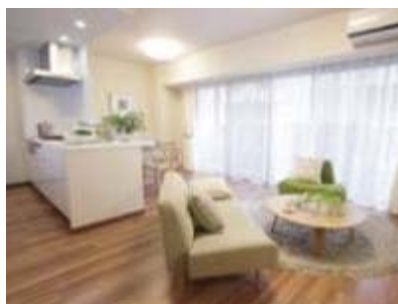
▲「お客様に快適なライフスタイルを提案することが、私たちの目指す姿です。」