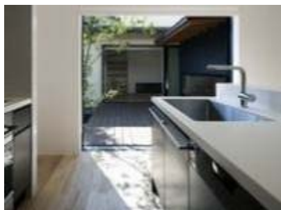
▲機能とデザインを両立させてこそ 「MY STYLE KITCHEN」なのです。

私達、コモプリュスは、 多くのハウスメーカーやデベロッパーでも導入が進んでいる 「別注のこだわりキッチン」のニーズにも応えられる 数少ないキッチンメーカーとして、 一人ひとりに合ったキッチンをオーダーメイドで提供しています。