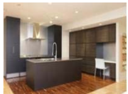
▲新店舗が続々とオープン！「京都」にもオープンしました。